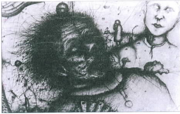
Arnulf Rainer, Sterbender Rainer (Fragment) , 1949

RAINER: Das Wort „Eigentlichkeit“ ist ein großes Problem für mich. Aber wenn man das existenzielle Moment nimmt – die Geburt, das Leben und der Tod – dann ist das schon etwas, das in meiner Arbeit eine Rolle spielt, zum Teil symbolisch, zum Teil in einer allgemeinen Form.